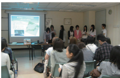
テーマ「地震」の発表

「行動する」ことは難しいことですが、募金や節電など今やれること、できることを判断し、速やかに行動することによって社会の一員として責任を果たしていくことがかけています。