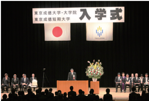
木内学長による告示

開催日が懸念されていただけに当日は大学院21名、大学人文学部81名、応用心理学部154名、子ども学部103名、経営学部100名、短期大学210名が参列し、会場は保護者の方も新入