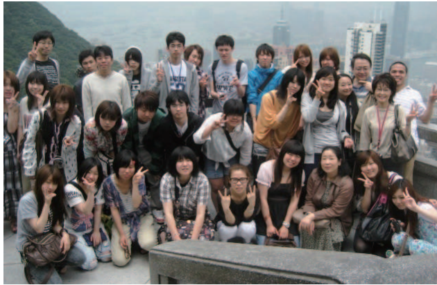
ビクトリアピークにて

国際言語文化学科の1年生が、5月23日(月)から4泊5日で香港・マカオに行ってきました。新入生学外特別授業として海外に出るのは、昨年のシンガポール・マレーシアに続いて2回目です。「初海外」はおろか「初飛行機」という学生もいましたが、全員元気で帰国しました。