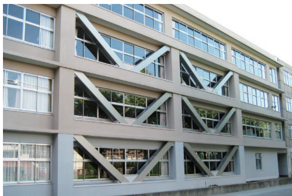
耐震補強の完了した高等部校舎

学園には昭和56年建築基準法施行令（新耐震基準）以前に建築された校舎があり、耐震性に不安が