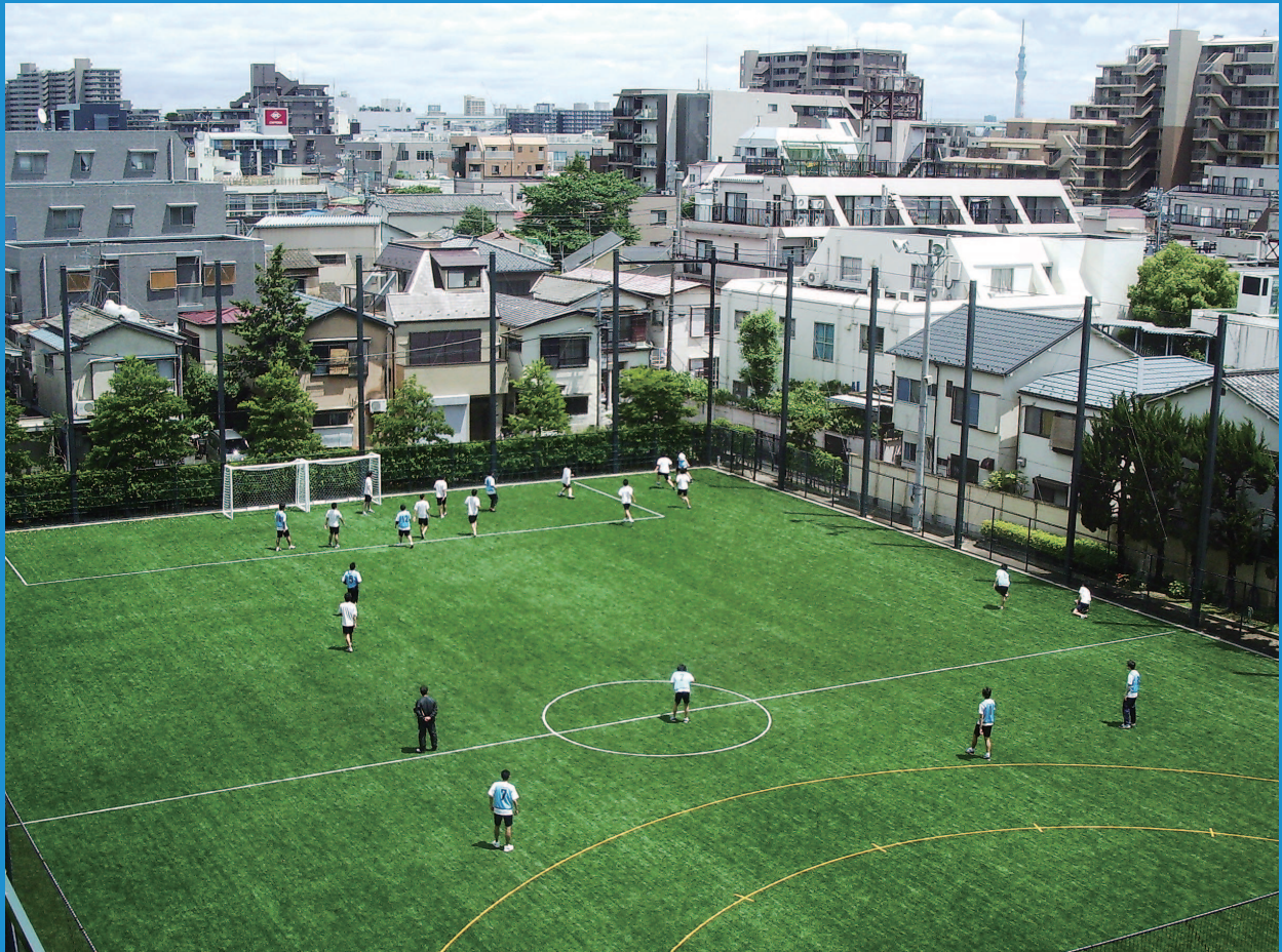
中高一貫部 東京スカイツリーを望む