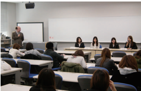
就職内定者による体験談

短期大学では1年の後期から就 職プログラムまた夏季に各種試験 対策講座等を実施し年末からの本 格的な就職活 動を支援して います。