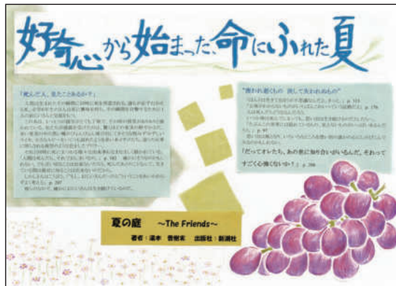
どくしょボードはホームページからご覧になれます。 http://www.asahi.com/shimbun/dokusho/koshien/

意見を出し合い決めました。さまざまな表現ができる手書きにもこだわりました。イラストでは鮮やかな葡萄と淡いコスモスを対照的に描き、選考委員の先生に褒められました。