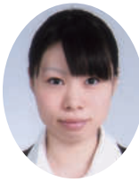
日本アンテナ(株)内定