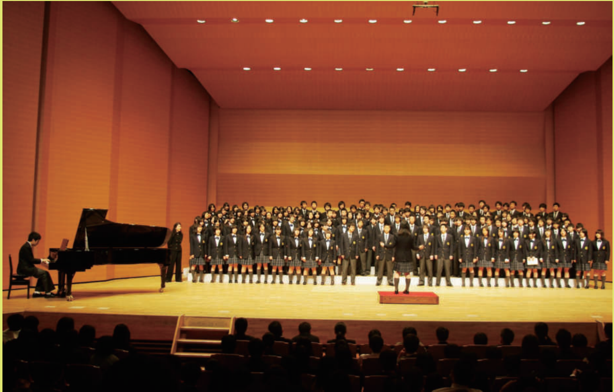
中高一貫部（中学）合唱祭