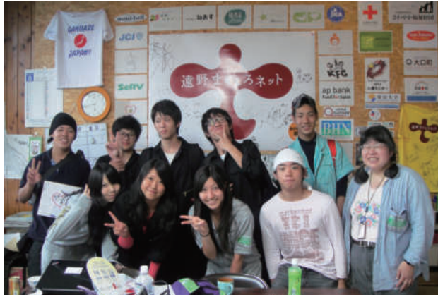
「遠野まごころネット」にて

かった部員も含め、ボランティア部の活動を報告するとともに復興支援のための募金活動を継続しました。また、生徒会からバザーの売り上げを預けられ、それに募金を加えて、活動を実感し、実態のわかるボランティア団体の「遠野まごころネット」に寄付をすることを部の意志で決定し、寄付をしました。