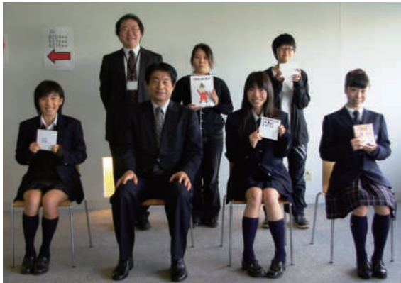
授賞式に参加された皆さん