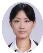
(株)ピーターパン 内定