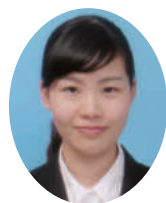
文京区立幼稚園 内定

なかなか結果がでない就職活動はとても大変ですが、あせらず自分のペーを崩さないで取り組めばきつといい会社に出会えると思います。皆さんのご健闘をお祈りいたします。