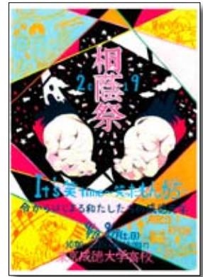
高等部(東京)の文化祭パンフレット 今年のテーマは「命がけで和たした成徳元年」