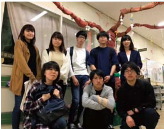
都立北療育医療センターにて

「当事者を支える家族や支援者支援の重要性を知り、視野が広がった」等、実習で得た学びは大きかったよう