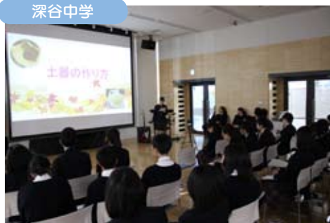
メインは学習発表会。今年は全員がパワーポイントを使用して発表