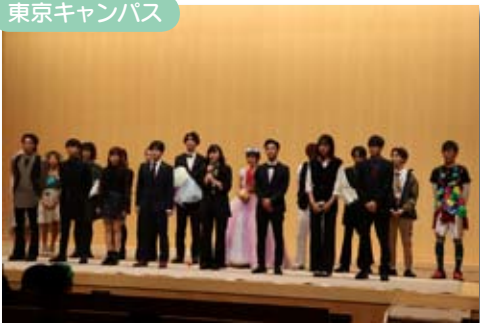
学園祭で経営学部ファッションコースによるファッションショー「fashion show' 19」のフィナーレ