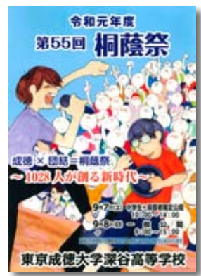
深谷校の文化祭ポスター