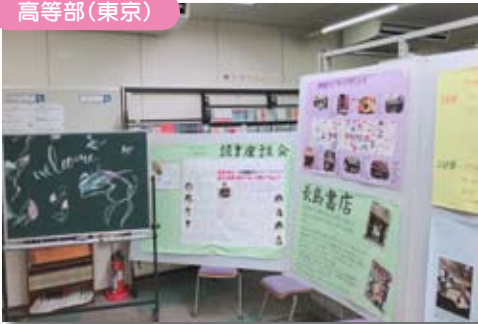
文化祭で奨励賞を受賞した文芸部の研究展示