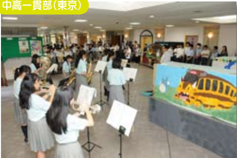
文化祭で吹奏楽部がオープニングコンサート