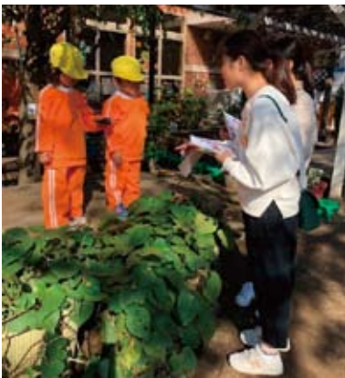
教職実践演習での園見学の一角

近年、想定外の災害が頻発している中、生徒が安心・安全な学校生活を送ることが出来るよう、関係機関との連携を密にしながら、より効果のある防災教育を進めていきたいと考えています。