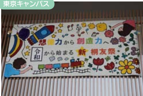
楷の木ホールのエントランスに制作された特大の学園祭ポスター