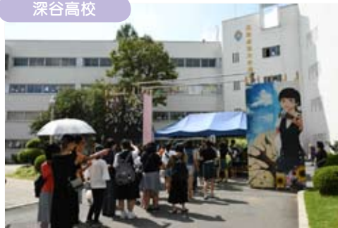
文化祭の来校者受付のようす。今年度は、2,786人が来校