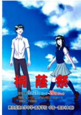
中高一貫部(東京)の文化祭パンフレット 今年のテーマは「令和、スターティン!!」