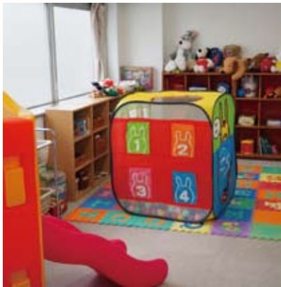
心理・教育相談センターのプレイルーム

さらに、大学院生は本学心理・教育相談センターにて学内実習としてケース担当を行っております。本大学院では教授、准教授、助教、特任教授、特任准教授、特任助教等が巡回指導や学内でのスーパービジョンなどを担当し、優秀な高度職業人を輩出すべく日々努力をしております。