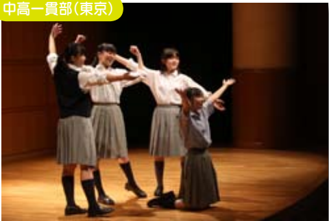
文化祭で合唱部が明るく元気にディズニーソングを歌唱