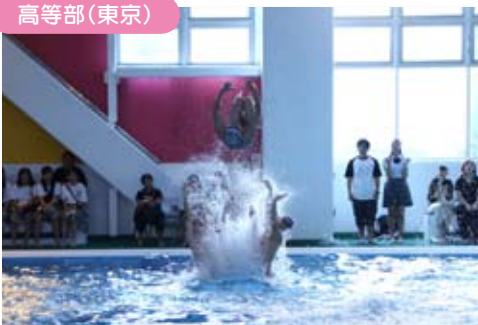
文化祭で水泳部がアーティスティックスイミングを披露