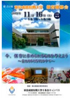
東京キャンパスで開催された短期大学主催の保育研修会のパンフレット