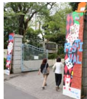
高等部文化祭で正門に制作された大看板