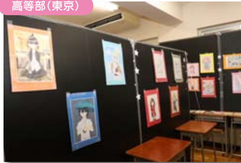
文化祭で優秀賞を受賞した漫画イラスト研究部の作品