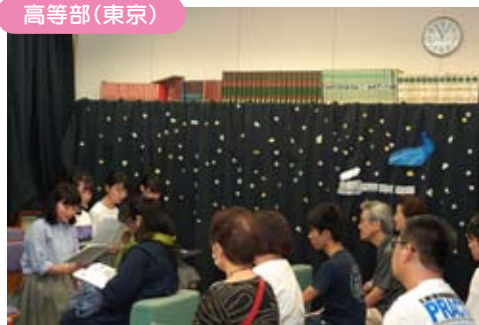
文化祭で奨励賞を受賞した演劇部の朗読劇