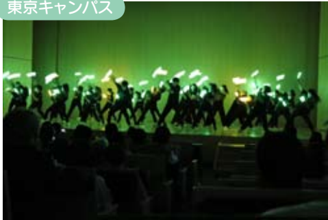
学園祭でダンスサークル fascino が躍動感あふれたさまざまなダンスを披露