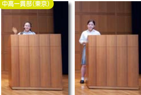
文化祭で中学校英語スピーチコンテストの決勝が行われ、3年の部に2名が優勝