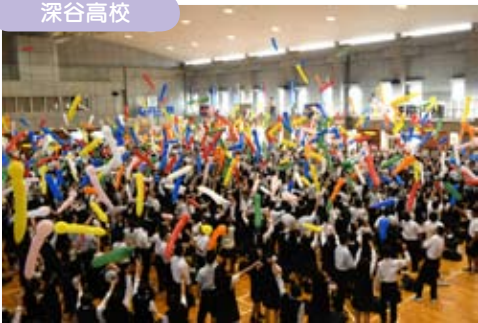
文化祭のフィナーレを飾るジェット風船飛ばし