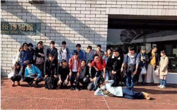
元気な日本伝統文化学科2年生（国立歴史民俗博物館にて）

博物館で新しくなったのは「先史・古代」をテーマにしたエリアです。学芸員実習希望学生がとても多