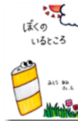
(アイデア賞) 三藤 愛未