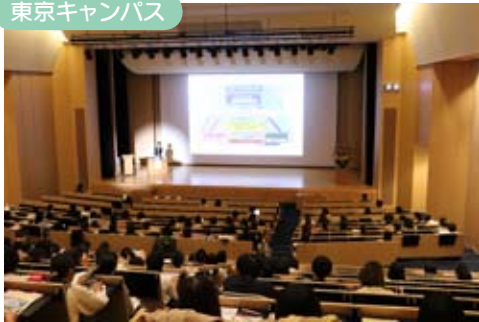
卒業生や地域の保育者など多くの保育者などが熱心に研修