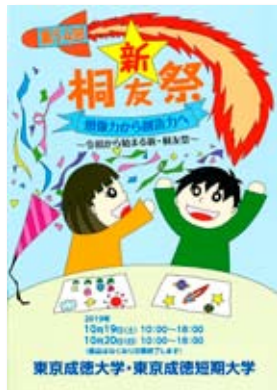
東京キャンパスの学園祭パンフレット 今年のテーマは「想像力から創造力へ」