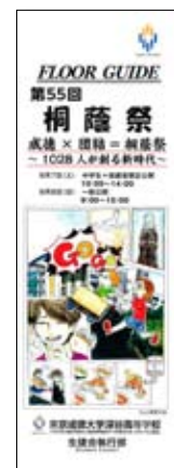
深谷校の文化祭パンフレット 今年のテーマは「1028人が創る新時代」