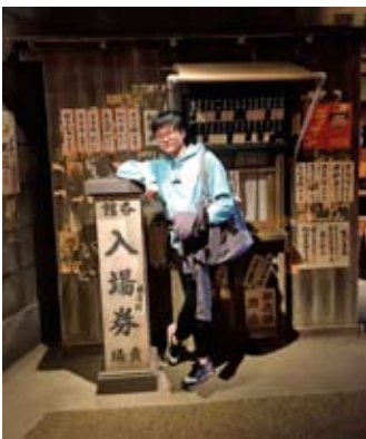
レトロな復元展示にとけこむ 伝統文化大好き学生

東京キャンパスの学園祭「桐友祭」には2年生有志が展示・ステージ参加し、千葉キャンパスの「翠樟祭」がなくなってしまう空白を埋めてくれました。こうしたアクティビティーへの参加も、学科の存在感を示すものとして重要であると考