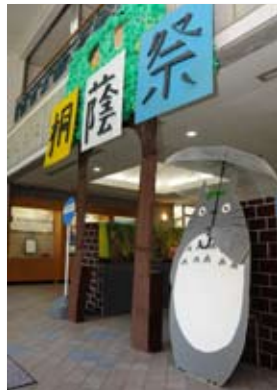
来場者を歓迎する入口ホールの制作物