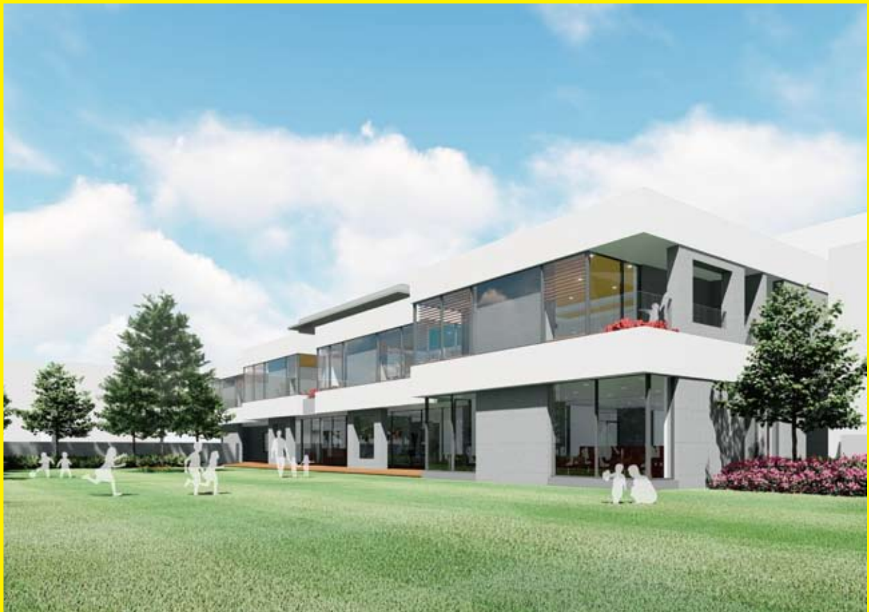
建替えにより 2021 年度中の竣工を計画する、幼稚園の新園舎完成イメージ図