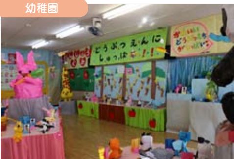
幼稚園の作品展で、年少組は動物園をつくり、園児全員が作品を発表