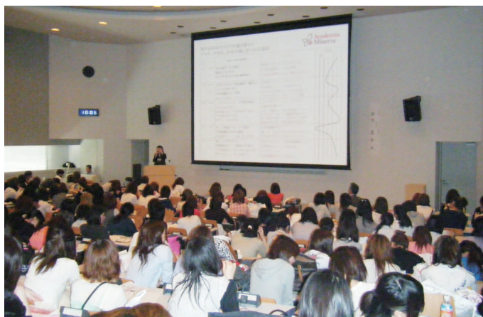
講師を招いての就職セミナー

し、言語文化コミュニケーション科64%、ビジネス心理科48%と大変厳しい結果となりました。就職先はホテル、IT関連等のサービス業を中心として金融、流通、食品製造と広範囲にわたっています。一方、幼児教育科では幼稚園及び保育所などの就職関係は100%でしたが、一般企業は67%となり、同科全体では昨年と同じ99%となりました。また卒業生の進学は11名が四年制大学に編入、11名が専門学校等に進んでいます。