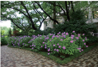
十条台キャンパスにて

http://www.tokyoseitoku.ac.jp/report/index.html