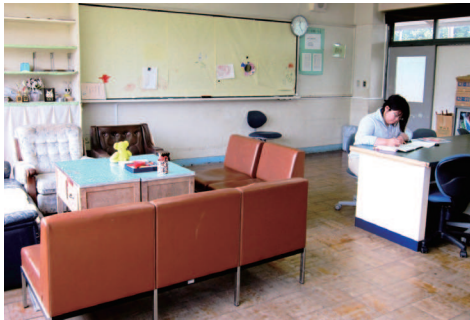
実習先の中学校の相談室

また、実習ではありませんが、援助を求めている患者さん、児童・生徒さんらと会うということは、その責任は重く、プロフェッショナルとしての高い意識と役割が求められます。