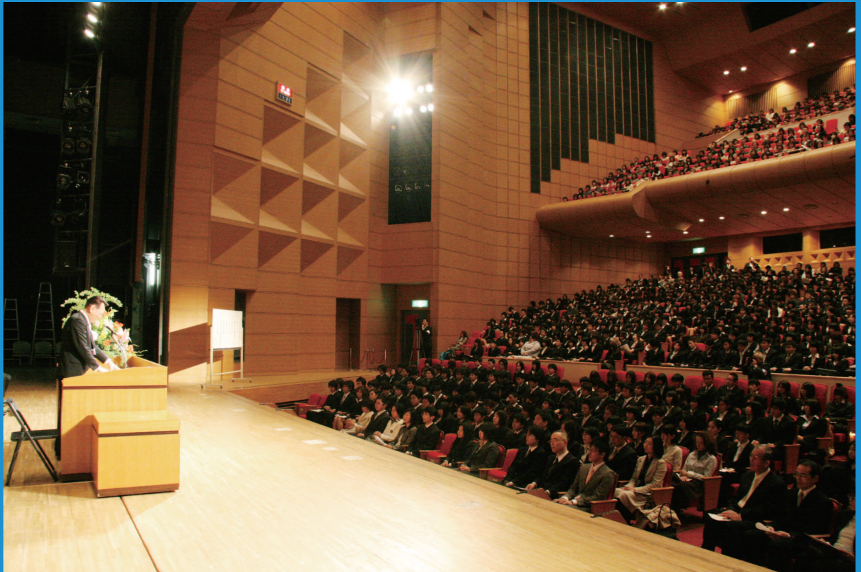
大学・大学院、短期大学初の合同入学式