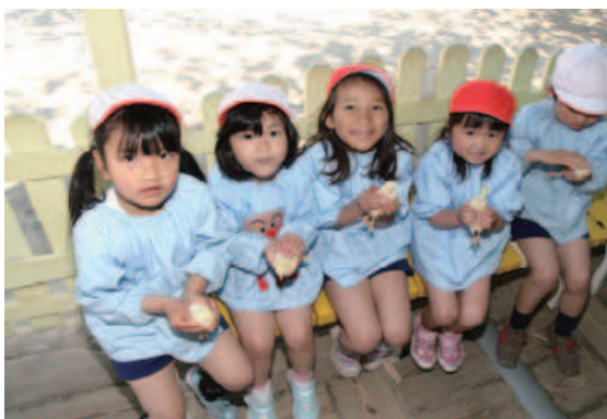
ヒヨコを抱いて笑顔の園児たち

行きのバスで、子どもたちは「動物園へいこう」などの歌を大声で歌い続けて大興奮でした。動物園では、お目当てのホワイトタイガーや自分たちのクラスの名前にもなっている「ゾウ」や「キリン」などの動物を目に焼き付けてきました。また、ウサギやヒヨコ、モルモットなどの小動物とのふれあいでは、年少児とかかわる時と同じくらい優しく声を掛けながら撫でていた姿がほほえましかったです。