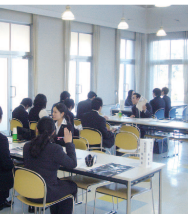
学内合同企業説明会

り長期間の就職活動を強いられる、という悪循環が起きています。途中で挫折しないためにも、「絶対に就職する」という強い意志が、ますます重要になってきています。私たちキャリア支援では、全体的な就職活動の流れに乗り遅れないように学生を支援しながら、モチベーションを低下しないように適切なアドバイスに注力しています。スタッフ全員がキャリアカウンセリングの有資格者である強みを更に発揮していきたいです。