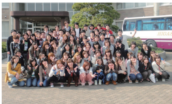
応用心理学部新入生オリエンテーション

世界遺産「日光の社寺」を見学。東照宮や大猷院の江戸期の文化遺産を堪能し、戦場ヶ原や華厳の滝などの日光の自然を見学。