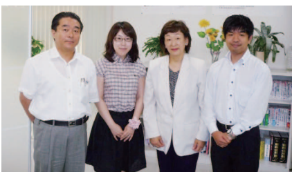
玉川教授とキャリア担当スタッフ

八千代キャンパスの各学部・学科、共通領域部、学生支援課キャリア担当では、密接な連携をとりながら、TSU就活プログラムに即して学生の就職活動を支援し、就職者と進学者の在籍者に対する比率が前年比を着実に上回ることを目標に、学生支援を進めてまいります。