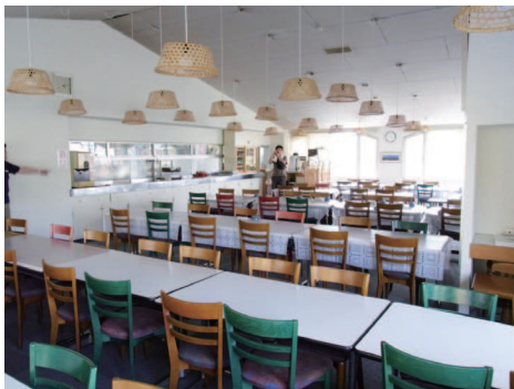
～戸隠高原ホテルのレストラン～

メインとなる建物は3階建ての本館と2階建ての別館で、生徒が寝泊まりする部屋は主に別館内のものであるでしょう。また、本館2階にある約120名収容のレストランと、そのすぐ近くにある約50名収容の大広間(和室)を利用することで、170名が同時に食事を取ることできます。レストランからはゲレンデを、大広間からは戸隠連峰を見渡せます。ただ、本館1階にある浴室はあまり広くはないので、入浴時間の設定には少し工夫が必要かもしれません。